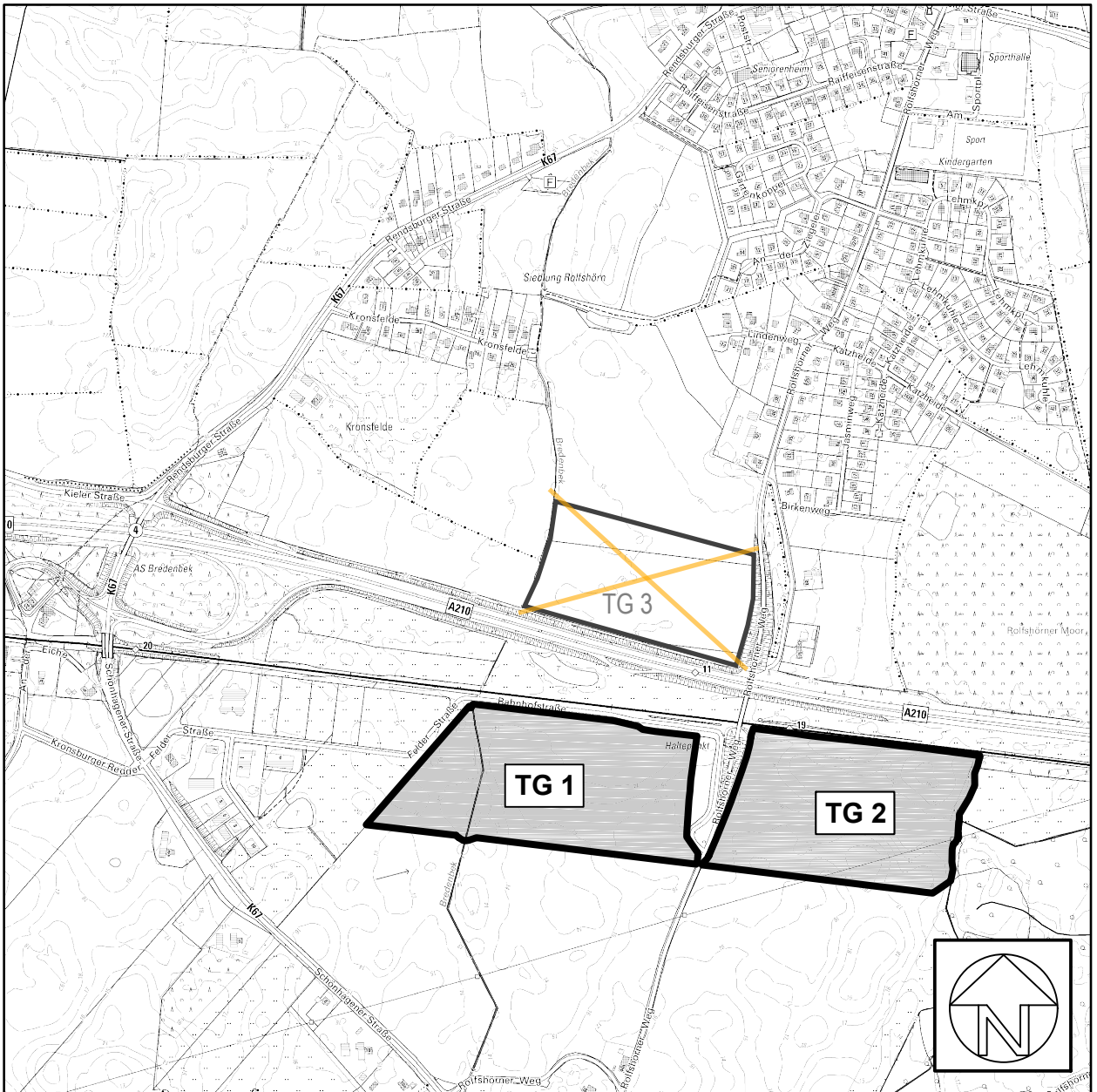
Übersichtskarte M = 1 : 10.000